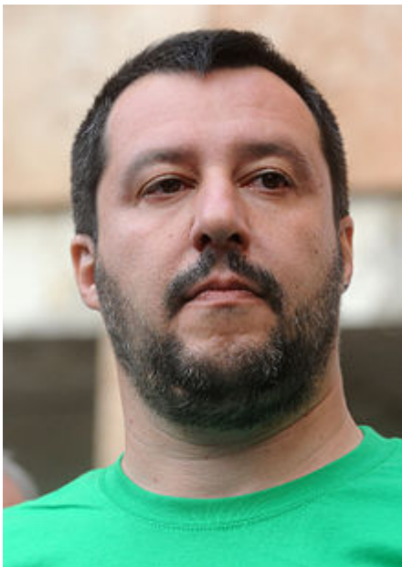
Matteo Salvini nel 2015

Salvini ha sollevato molte critiche per un coro che ha intonato con offese verso i napoletani. [146] Accadde alla festa di Pontida del 2009 dove venne ripreso in un video. [147][148] A seguito delle conseguenti polemiche Salvini si scusò ufficialmente per l'accaduto sottolineando il fatto che si trattava di semplici cori da stadio. [149]