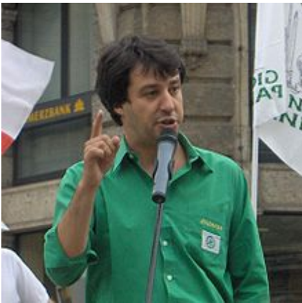
Salvini durante un comizio dei Giovani Padani nel 2006.

Pochi mesi dopo, durante una visita ufficiale a Palazzo Marino del Presidente della Repubblica Carlo Azeglio Ciampi, si rifiutò di stringere la mano al capo dello Stato; in una nota egli affermò di avergli detto: «No grazie, dottore, lei non mi rappresenta». [14][34][35]