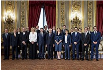
Matteo Salvini, primo a destra, nel giorno del giuramento del Governo Conte I a Palazzo del Quirinale con Sergio Mattarella, il 1° giugno 2018

Il 1° giugno 2018 viene ufficialmente nominato Ministro dell'interno e Vicepresidente del Consiglio dei ministri del Governo Conte I, un esecutivo nato con l'appoggio della Lega e del Movimento 5 Stelle.