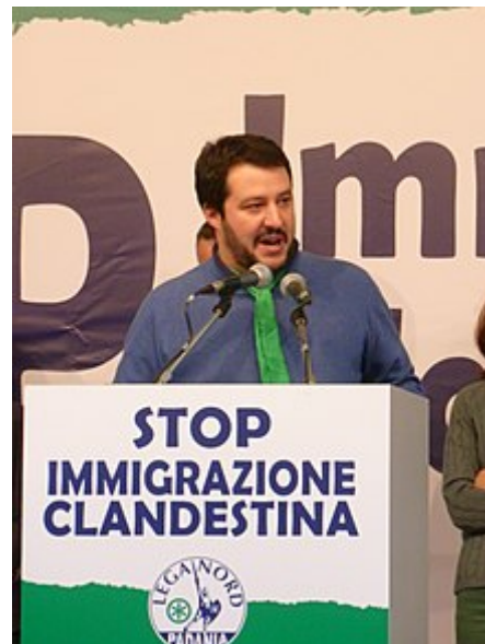
Matteo Salvini parla durante una manifestazione della Lega Nord nel 2013.

Il 15 agosto 2016 dichiara sul palco della festa annuale della Lega a Ponte di Legno che bisogna "ripulire le città dagli immigrati" e "dare mano libera a Carabinieri e Polizia". [158] Tali affermazioni provocarono, oltre alle reazioni delle altre forze politiche, anche le proteste dei sindacati di polizia. [159]