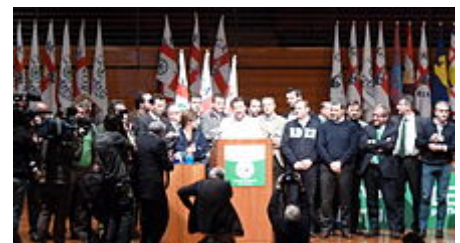
Discorso di Salvini prima di essere eletto segretario federale della Lega Nord.

Il 7 dicembre 2013 vince le primarie degli iscritti contro Umberto Bossi e, con 8 162 voti (pari all'82% delle preferenze), viene eletto segretario federale della Lega Nord. [52][53] La proclamazione ufficiale è avvenuta al congresso federale straordinario tenutosi al Lingotto di Torino il 15 dicembre, dove è stato eletto a maggioranza dai delegati del partito. [53][54]