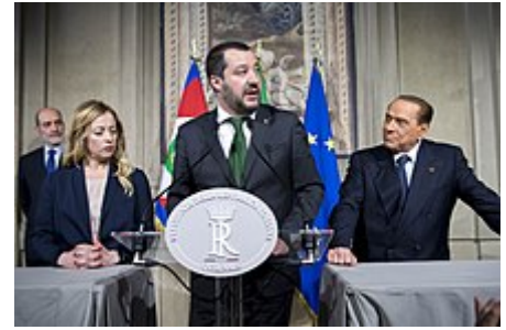
Salvini tra Giorgia Meloni e Silvio Berlusconi alle consultazioni al Quirinale, 12 aprile 2018.

Il 1° giugno 2018 viene ufficialmente nominato Ministro dell'interno e Vicepresidente del Consiglio dei ministri del Governo Conte I, un esecutivo nato con l'appoggio della Lega e del Movimento 5 Stelle.