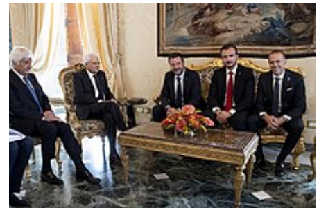
La delegazione della Lega alle consultazioni con il Presidente Mattarella in seguito alle dimissioni del Presidente del Consiglio Giuseppe Conte.

Salvini viene considerato un euroscettico, avendo egli spesso espresso posizioni estremamente critiche nei confronti dell'Unione europea e specialmente dell'euro, che ha definito "un crimine contro l'umanità". [50][98] Salvini si è fermamente opposto all'immigrazione clandestina in Italia e in Europa e ha pesantemente criticato la politica di accoglienza portata avanti dai governi di centro-sinistra. [99][100] La sua visione politica è stata definita dai quotidiani britannici The Guardian e The Independent e dalla rivista Politico di estrema destra [101][102][103][104][105] per via di alcune sue posizioni e proposte quali, ad esempio, la necessità di un censimento della comunità Rom in Italia e conseguente espulsione di tutti i nomadi presenti illegalmente sul territorio nazionale. [106]