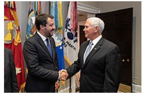
Salvini con il Vicepresidente degli Stati Uniti Mike Pence

Il 9 agosto 2019, dopo numerose tensioni all'interno della maggioranza, la Lega presenta una mozione di sfiducia nei confronti del Governo. Il 20 agosto, Conte si presenta nell'aula del Senato e, nel corso del dibattito, accusa Salvini di essere un opportunista politico e di aver aperto la crisi al solo scopo di rincorrere interessi personali e di partito. [96] Lo stesso 20 agosto, la Lega ritira la mozione di sfiducia precedentemente presentata; a seguito del dibattito, nondimeno, Conte decide ugualmente di rassegnare le dimissioni. [97] Resta in carica fino al 5 settembre 2019, giorno del giuramento del Governo Conte II.