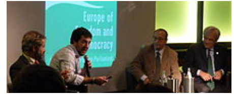
Salvini al convegno No Euro Day con i professori Claudio Borghi, Alberto Bagnai e Antonio Maria Rinaldi.

«L'euro è un crimine contro l'umanità. Prima salta l'euro, prima posso riprendere la battaglia per l'indipendenza (...) [l'euro] ha fatto strage peggio dei panzer nazisti.»