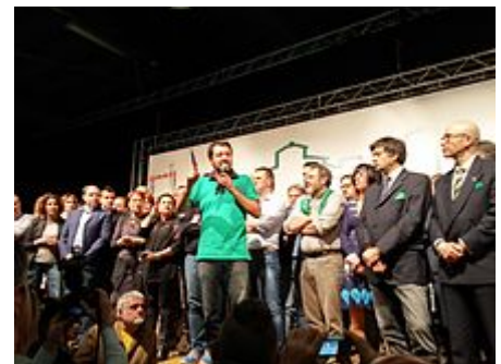
Matteo Salvini nel 2015.

Nello stesso mese, Flavio Tosi ha avanzato la possibilità di candidarsi alla presidenza della regione Veneto. Ciò ha portato a forti contrasti tra Tosi e Salvini. Quest'ultimo ha ventilato la possibilità di espulsione di Tosi dalla Lega [75] che è avvenuta il successivo 10 marzo. [76]