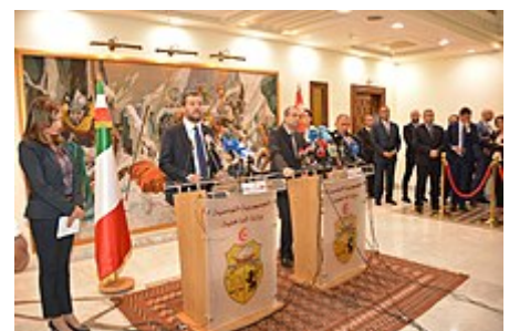
Il ministro Salvini con il suo omologo tunisino Hichem Fourati nel settembre 2018

Il 24 gennaio 2019 è indagato per sequestro di persone aggravato. Il tribunale dei ministri di Catania dispone la trasmissione degli atti e del presente provvedimento al procuratore della repubblica di Catania, affinché ne curi l'immediata riemersione al presidente del Senato per l'avvio della procedura. L'ipotesi di reato formulata nei confronti di Salvini è quella di sequestro di persona aggravato dall'abuso di potere, poiché, avendo bloccato la procedura di sbarco di nave Diciotti il