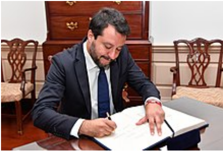
Salvini firma il libro degli ospiti del segretario di Stato USA Mike Pompeo, 17 giugno 2019.

In un'intervista del 1998 alla rivista Il Sole delle Alpi Salvini si dichiarava favorevole alla legalizzazione delle droghe leggere. Il 6 ottobre 2014, ospite a Coffee Break su La7, si dichiarava aperto ad un dibattito sulla legalizzazione. [111][112] Successivamente, tuttavia, si è schierato su posizioni fortemente contrarie alla liberalizzazione di qualsiasi tipo di droga. [113]