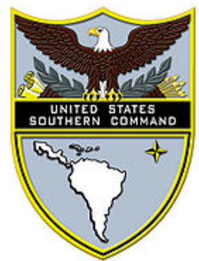
Emblema dell'US Southern Command

Wikinews ha ottenuto il documento e ne ha condotto un'analisi approfondita. La American Civil Liberties Union (unione americana per le libertà civili) aveva richiesto in precedenza alle autorità di poter ottenere delle copie del manuale, ma fu loro negata la possibilità.