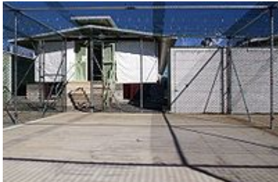
Camp Delta, una delle sezioni del campo di Guantanamo

In un'indagine riportata in esclusiva da Wikinews, il sito Wikileaks ha oggi rivelato un'altro capitolo della storia del manuale militare di procedura per le operazioni standard ( Standard Operations Procedure ) del campo di detenzione della Baia di Guantanamo